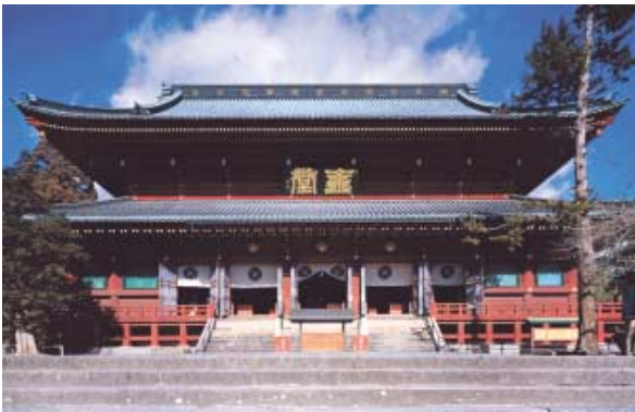
Abb.: UNESCO-Weltkulturerbe – Der buddhistische Tempel Rinno-ji in Nikkō.

Die Präfektur Tochigi gehört zur Region Kanto auf der Insel Honshū. Rund 2 Millionen Einwohner leben in den zugehörigen 33 Gemeinden. Die Präfektur Tochigi ist sowohl für Japaner als auch für ausländische Touristen ein beliebtes Reiseziel und bietet zahlreiche Sehenswürdigkeiten.