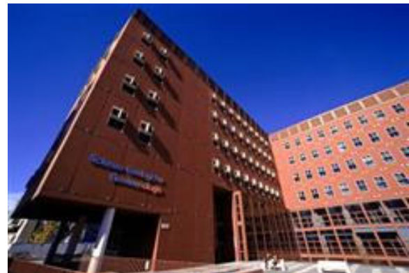
Abb.: Universität Mailand-Bicocca

Die Universität wurde 1998 gegründet und ist im Mailänder Stadtteil Bicocca ansässig. Rund 30.000 Studenten nutzen heute das Studienangebot aus insgesamt acht Fachbereichen.